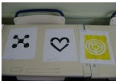
Figura 5-Stencil pronto