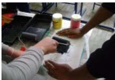
Figura 4-Aplicação do Stencil