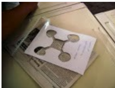
Figura 3 - Matriz do Stencil