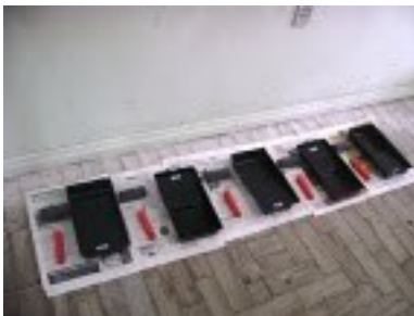
Figura 2 - Suporte para por as tintas